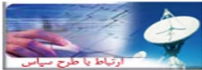
ارتباط با طرح سانس