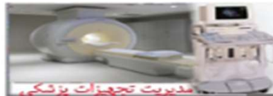
مدیریت تجهیزات پزشکی